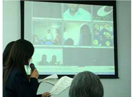
人と防災未来センターでのひょうご e-スクール・テレビ会議の様子

世界的な教育ネットワークのインターネットフォーラム(掲示板)やテレビ会議システムを協働学習のツールとして活用し、情報交換をおこなっています。これにより地球規模の課題を世界の子どもたちが協働でとりくむ防災協働学習を推進することができます。