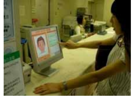
京都市立病院におけるM 3 利用の様子

現在、京都市立病院に多言語医療受付支援システムM 3 （エムキューブ）を導入し、用例対訳を用いた多言語対話の支援を行っています。M 3 は用例対訳を用いた受付支援機能を提供しており、病院の受付を母語で行うことができます。