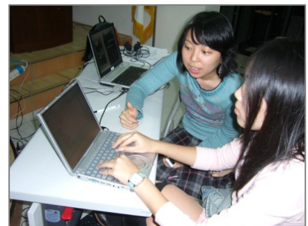
韓国ボランティアスタッフとのミーティング